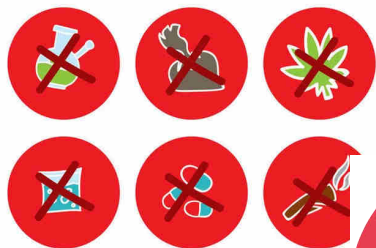
ПРОПАГАНДА НАРКОТИКОВ И АЛКОГОЛЯ