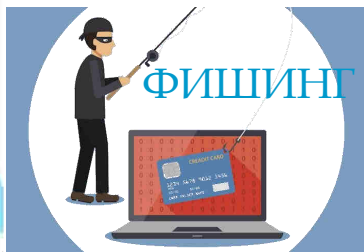
Интернет - мошенничество